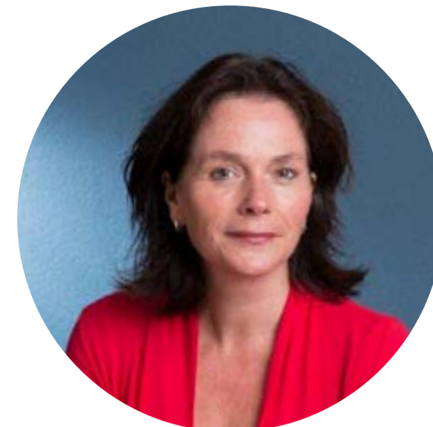
Monique Vogelzang Inspecteur-generaal van het onderwijs