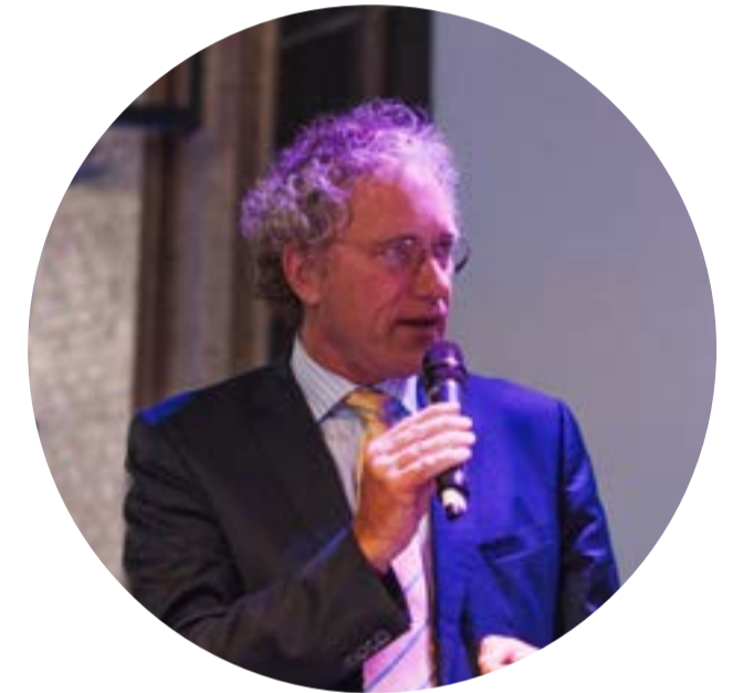
Thom de Graaf Voorzitter Vereniging Hogescholen