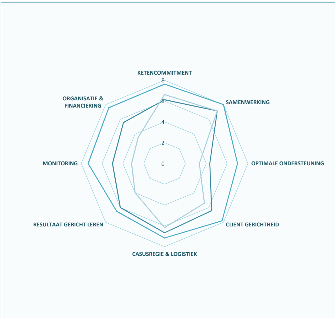
Figuur 3. Clusterscores per respondent

* Fase- en clusterscores worden alleen berekend als meer dan de helft van de betreffende items is ingevuld